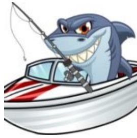
فیشینگ یا فیک پیج

اجازه بدهید من خودم را با پاسخ به این سوال خسته نکنم! چون قبلا در مورد این مورد بارها به شما در این سایت هشدار داده ام: لینک زیر را مطالعه نمایید تا تکرار مکررات نشود!