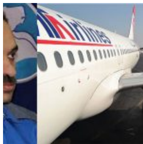
صادقیان در هواپیمایی اتا