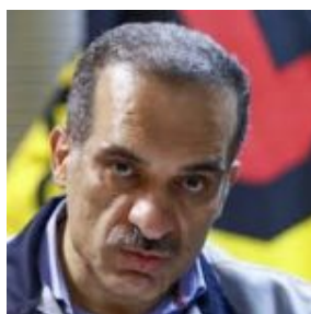
صادقیان چهره صنعتی و خشن

وی نباید بازیکنان فوتبال باشگاه تراکتور سازی تبریز که هر کدام رند بالا هستند با کارگران کارخانجات تحت مدیریت خود اشتباه بگیرد و رفتاری مشابه با بازیکنان در پیش گیرد!